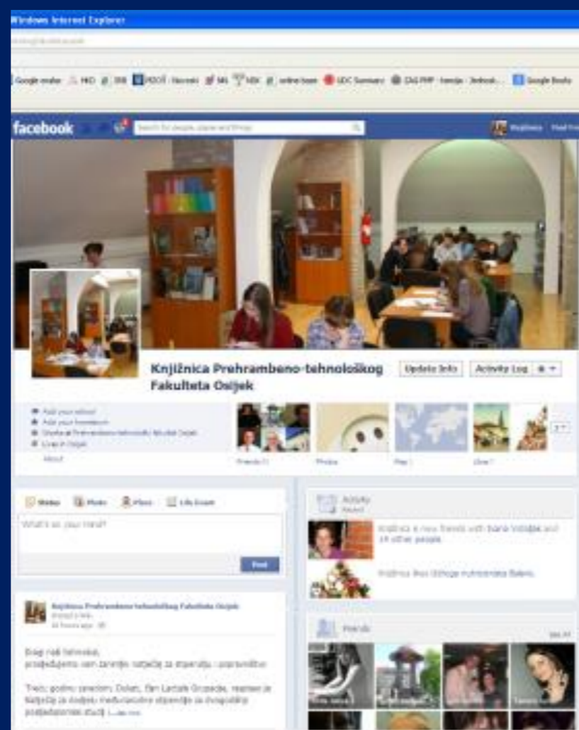
Facebook (od 2013. g.)