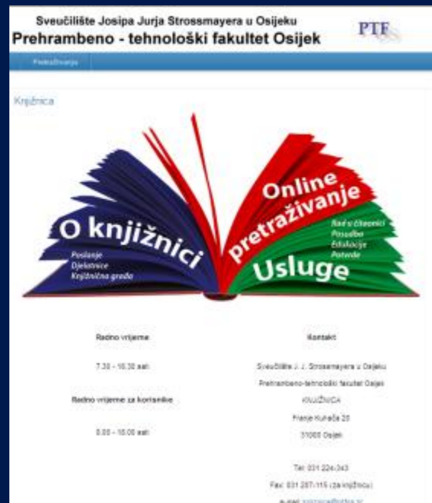
mrežna stranica (od 2001. g.)

2 Gradska i sveučilišna knjižnica Osijek; Europske avenije 24, 31000 Osijek