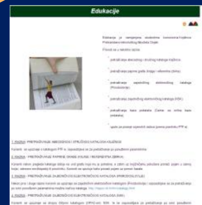
edukacija (od 2006. g.)